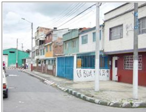
Panorámica barrio La Cabañita Cll. 23H con Cra. 102 Bis.

sus respectivas acometidas para cada uno de los hogares. El acueducto y la pavimentación de vías se hicieron en 1968, obras que lograron mostrar el desarrollo y el progreso en la comunidad.