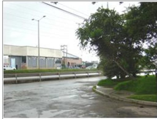
Panorámica Avenida Centenario o variante con Cra. 113A .

tempranas horas de la madrugada; dicen que les gustaba mucho pues era fresca, de buen sabor y muy económica.