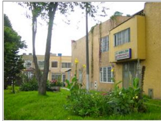
Panorámica Urbanización Santiago Cra. 114 con Cll. 17.

y Transporte en su momento, hicieron varias visitas al sector, verificaron y autorizaron la colocación de las talanqueras, algunos reductores de velocidad y policía vial durante todo el día en la zona. En 1995 se autorizó al barrio a hacer una reducción o angostamiento de la vía que hoy es la carrera 113, evitando el acceso a vehículos de mucho peso. Sin embargo, en lo que los residentes consideran un gran revés, en el año 2010 la Alcaldía local tomó la decisión por conceptos de movilidad de tumbar las talanqueras y el angostamiento ya realizados con previa autorización de distintas autoridades.