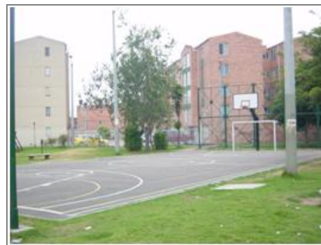
Parque Principal barrio El Rubí.

Según versiones de la comunidad, el primer local comercial inaugurado fue el bar “Tablas”, y la primera tienda que abrió sus puertas al público fue “la Tienda de Doña Carmen”, donde se distribuía a la comunidad productos para el consumo cotidiano.