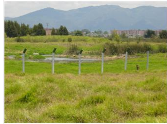
Humedal Capellanía barrio Rincón Santo.

del humedal Capellanía, en el que incluso se pescaba trucha.