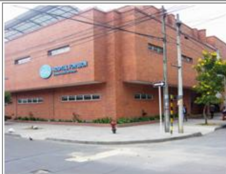
Hospital de fontibón, barrio Centro A.