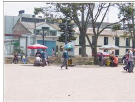
Plaza Fundacional Carrera 99 con calle 17A Barrio Fontibón Centro.

El uso del suelos en los años 60 de algunos de los predios que hoy día hacen parte del barrio y otros en sus alrededores era netamente agropecuario, destacándose cultivos de pan coger y la cría de ganado lechero. Por esta misma época comienza la construcción en serie de nuevas viviendas y la llegada de nuevos habitantes, situación que se mantiene hasta mediados de la década de los años 70, cuando se terminan de consolidar el barrio.