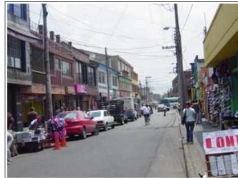
Comercio Calle 19 con carrera 100 Barrio Fontibón Centro.

Un factor que sin duda ha marcado la dinámica del barrio ha sido la gran concentración de las actividades comerciales. En un comienzo éste se dio en torno al parque principal, pero en los últimos 30 años, esta actividad se expandió sobre la calle 17 y las carreras 99 y 100. En la actualidad la mayor parte de éste actividad se ha transformado, para dar paso al comercio de alto impacto, representado por entidades bancarias como Bancolombia, Banco de Bogotá, BBVA, Banco Caja Social, Davivienda, Banco Popular entre otros; por supermercados de cadena como Cafam y Tia y un número considerable de centros comerciales, restaurantes y almacenes de ropa y calzado.