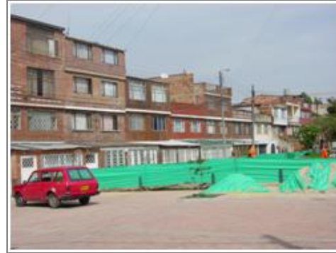
Panorámica barrio Thallía.

Posteriormente, la comunidad debió gestionar ante la Secretaría de Obras Públicas del Distrito la pavimentación de las vías, para lo cual fue necesario adquirir un crédito que fue cancelado en cuotas de tres mil pesos mensuales. No obstante, obras como la ampliación de la calle 17 C debieron esperar durante mucho tiempo y solo hasta hace dos años se logró el propósito.