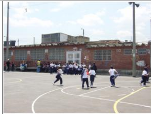
Salón comunal y cancha múltiple, carrera 104 con calle 23 G