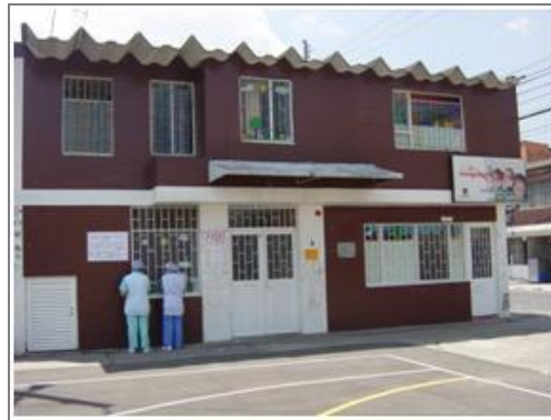
Jardín infantil de integración social Carrera 104 Con Calle 23 G.

algunos hogares aún se conserva y esa agua servía para el lavado de ropa y baños. Hacia 1972 por petición de la comunidad y gestión de la JAC de la época, se comienza la construcción del alcantarillado de aguas negras y del acueducto que traería agua potable para la población, quienes pagarían por cuotas las redes y acometidas en sus hogares. En el mismo año, también llegó la energía, la cual comenzó a instalarse dos años atrás y poco a poco el servicio fue ampliado y mejorado para una mejor cobertura, puesto que antes solo las lámparas de petróleo eran las que iluminaban las noches frías en el barrio.