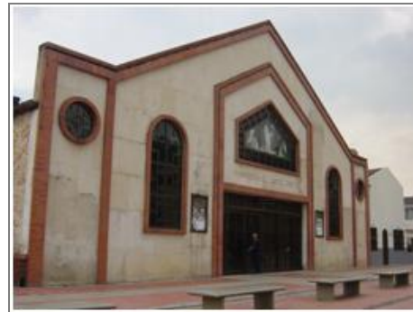
Parroquia Santo Cristo carrera 109 con calle 22 barrio Internacional.

La principal vía del barrio inicialmente fue la calle 37 actualmente calle 23 D, y luego la carrera 109; ambas pavimentadas en 1976 con recursos de la comunidad y mano de obra contratada con recursos de un particular; La interventoría de la obra fue realizada por la EAAB. Al mismo tiempo se comenzó la construcción del salón comunal, con recursos de la Oficina de Obras Públicas y mano de obra de los propios habitantes. La iglesia fue construida por la curia de la época gracias a la gestión del padre Eneas. Más adelante se construyó el parque principal que se encuentra ubicado en la misma carrera 109 con calle 35, el mismo punto en el que hace relativamente poco se construyó el CAI de Versailles.