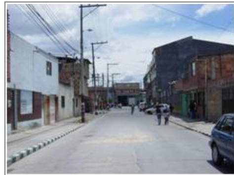
Panorámica barrio El Tapete.

En 1976, el distrito autoriza a la JAC de la época, la construcción del salón comunal, y dos años más tarde Acción Comunal Distrital elabora los planos. La misma comunidad construyó las bases de este gran proyecto, efectuando además actividades como fiestas, rifas y bazares para recaudar el dinero que se necesitaba. El precandidato Luis Carlos Galán decido un día aportarle a la comunidad $300.000 para adquirir los materiales a la Caja Popular de Vivienda, mientras que Acción Comunal Distrital aportó para su conclusión, que se logró en 1995.