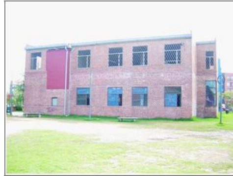
Salón Comunal Urbanización Cofradía.