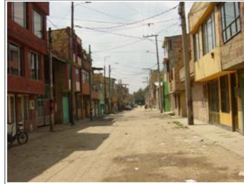
Panorámica Barrio Casandra.

La mayor parte de las viviendas tienen dos pisos y terraza, o tres pisos, algunas con apartamentos para arrendar. La modalidad de inquilinato se presenta con frecuencia pero de manera no muy visible. En algunos hogares hay hacinamiento. De acuerdo a la JAC, cerca del 75% de los habitantes son propietarios y 30% arrendatarios.