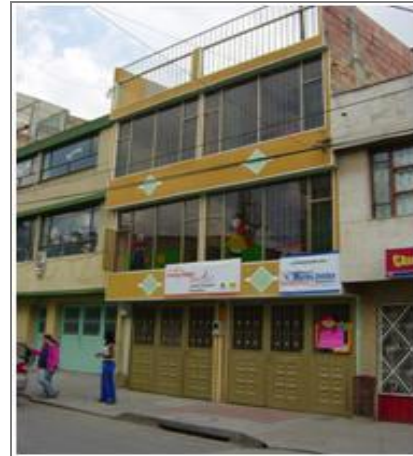
Jardín Infantil de Integración Social Barrio Casandra.

energía, el teléfono en 2000, el acueducto en 2002 junto con el gas natural y el alcantarillado en 2005, pues los predios se servían de tuberías informales y pozos sépticos, uno de los cuáles aun existe en muy malas condiciones sobre el límite del barrio con el río Bogotá. En 1999 la propiedad de los predios se legalizó completamente.